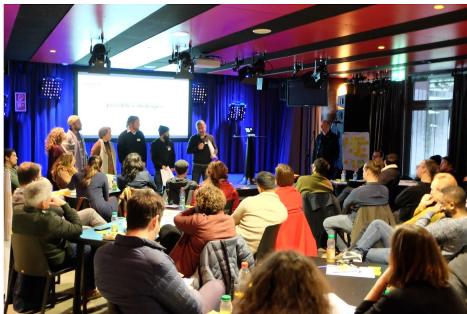
Plénière Rockhal, janvier 2023

Les collèges se sont réunis 12 fois en 2022.